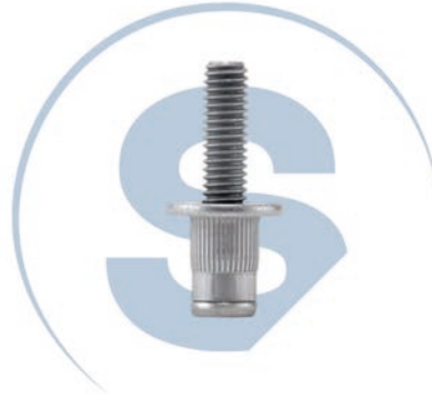
Tornillos Remachables Rivet Studs